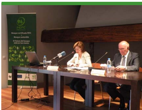
Jornada técnica celebrada en Valencia

Difusión. Tanto la celebración de las jornadas como los diferentes materiales editados, la página web del proyecto y el observatorio han contribuido a informar y sensibilizar a un elevado número de trabajadores acerca de la importancia de llevar a cabo una gestión sostenible de los bosques.