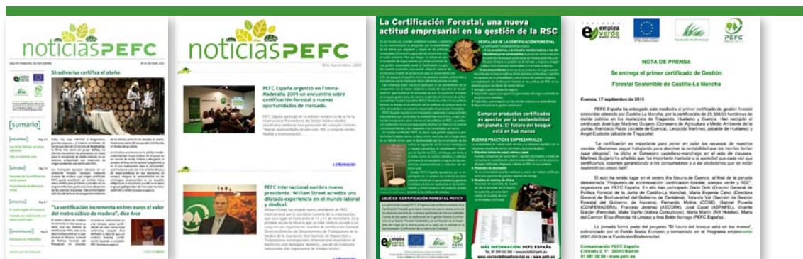
Boletines trimestrales, mensuales, publlirreportajes y notas de prensa

En cuanto a los estudios, el diagnóstico para el uso de madera y corcho en la construcción sostenible analiza el contexto económico, social y ambiental de la construcción sostenible y las iniciativas de carácter público y privado en relación con la integración de la sostenibilidad en los edificios de nueva construcción y en la rehabilitación de viviendas. Además, se identifican las oportunidades de uso de materiales de origen forestal sostenible en la construcción y se recogen propuestas de mejora para impulsar el uso de la madera y el corcho en la construcción sostenible.