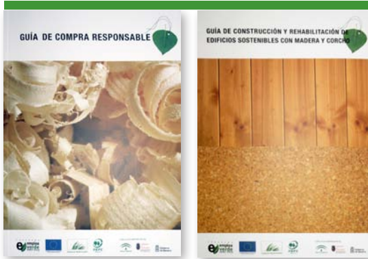
Portadas de las guías sobre compra responsable y sobre construcción y rehabilitación de edificios sostenibles con madera y corcho

Por último la guía sobre construcción y rehabilitación de edificios sostenibles con madera y corcho muestra los pasos necesarios para la implantación de la certificación PEFC a fabricantes de muebles, puertas, ventanas, tarimas, estructuras y elementos decorativos de madera u otros productos forestales.